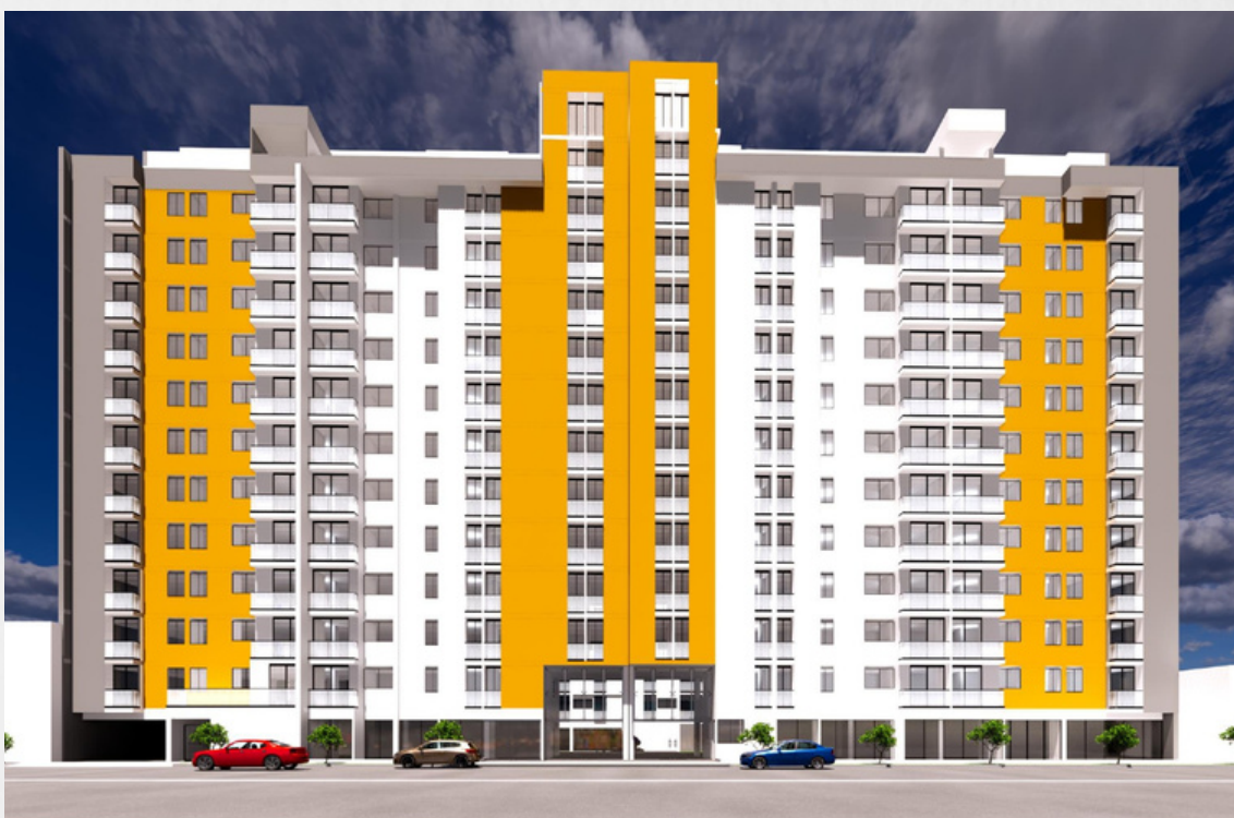
Urb. San Nicolás